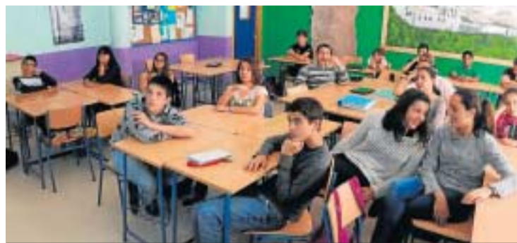
Unos alumnos del taller 'La prensa en las escuelas'.

lación a la igualdad de género. Serán talleres de dos horas de duración bajo el título La igualdad es noticia , que tiene como objetivo presentar ante el alumnado el tratamiento que hacen los medios de las noticias relacionadas con la igualdad y el género, y la construcción y el mantenimiento de estereotipos.